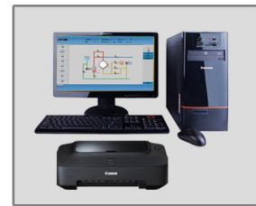
配备电脑及打印机